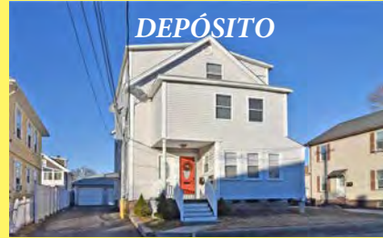
PAWTUCKET 3 famílias $499.900