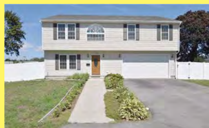
EAST PROVIDENCE Colonial $599.900