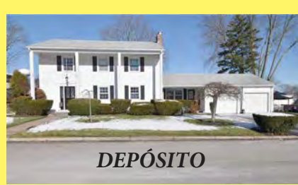
EAST PROVIDENCE Colonial $499.900