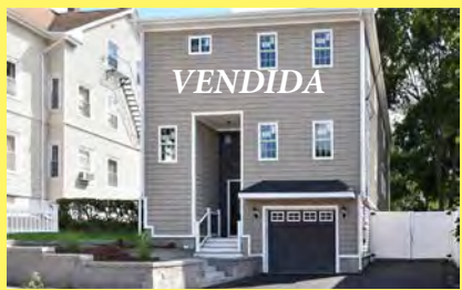
PAWTUCKET Casa nova de 2 moradias $699.900