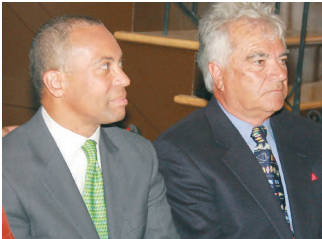
João Carlos Pinheiro com o antigo governador de MA, Deval Patrick.

No verão, quando estão de férias são instrutoras de vela no Clube Naval. Por aqui se depreende que a vela vai continuar”, conclui Victor Pinheiro.