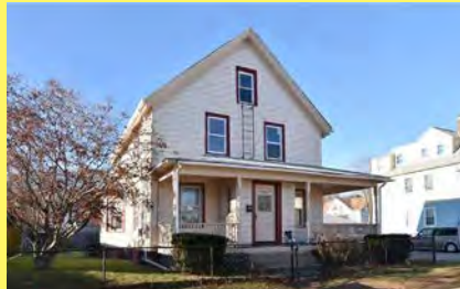
EAST PROVIDENCE 3 apartamentos $449.900