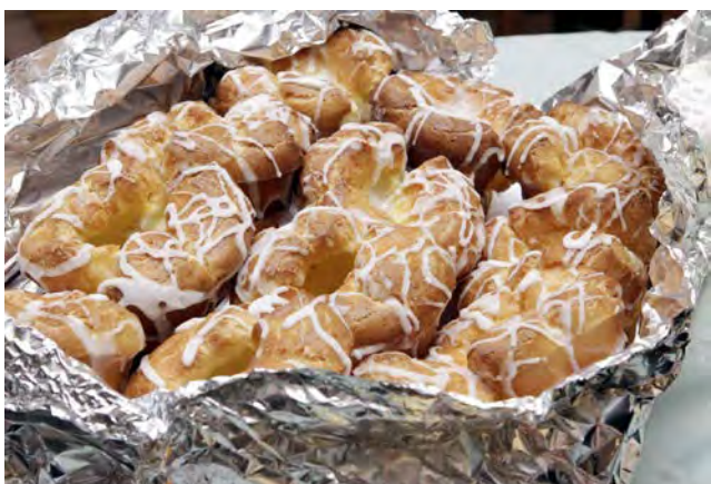
Não poderiam faltar as bem confeccionadas e apetitosas cavacas.

LUSO-AMERICAN FINANCIAL A FRATERNAL BENEFIT SOCIETY