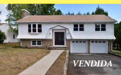
EAST PROVIDENCE Raised Ranch $499.000