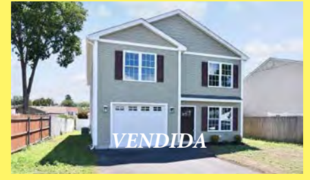
EAST PROVIDENCE Colonial $499.900