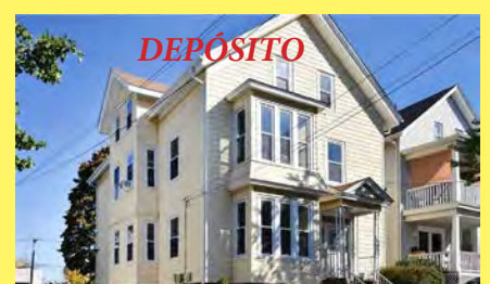
EAST SIDE 2 famílias $699.900