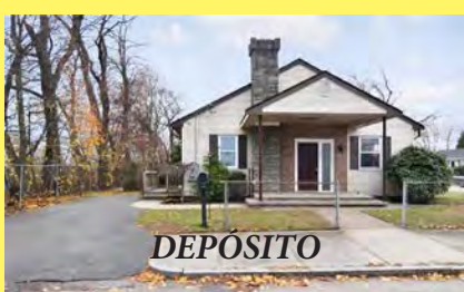
EAST PROVIDENCE Duplex $429.900