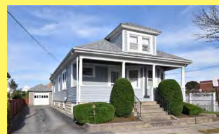
EAST PROVIDENCE Bungalow $299.900