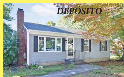
BARRINGTON Ranch $479.900