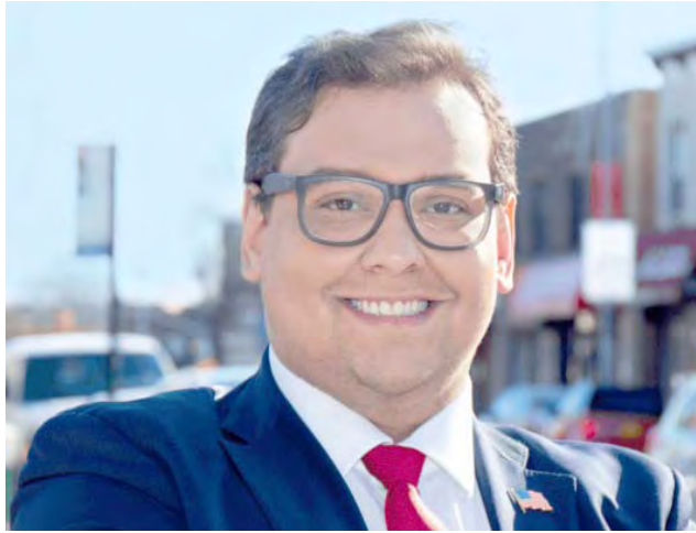
Congressista George Santos

George Santos teve mais de 140.000 votos no 3º distrito do estado de New York, tradicionalmente bastante leal ao Partido Democrata. Só que desta vez os eleitores escolheram um jovem republicano filho de imigrantes brasileiros, que se apresentou como uma “plena personificação do sonho