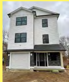
WARWICK Colonial $499.900