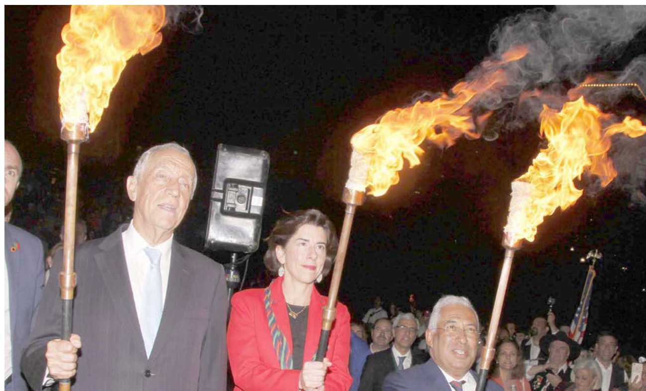
A foto remonta a 2018, aquando da histórica visita do Presidente da República de Portugal, Marcelo Rebelo de Sousa a Providence, por ocasião das celebrações do Dia de Portugal em Rhode Island, vendo-se ainda na foto a antiga governadora do estado, Gina Raimondo e o primeiro-ministro português, António Costa.

Falta acrescentar as datas para o torneio de golfe, o festival de gastronomia e folclore, o concurso Miss Dia de Portugal e a prova de Atletismo 5K.