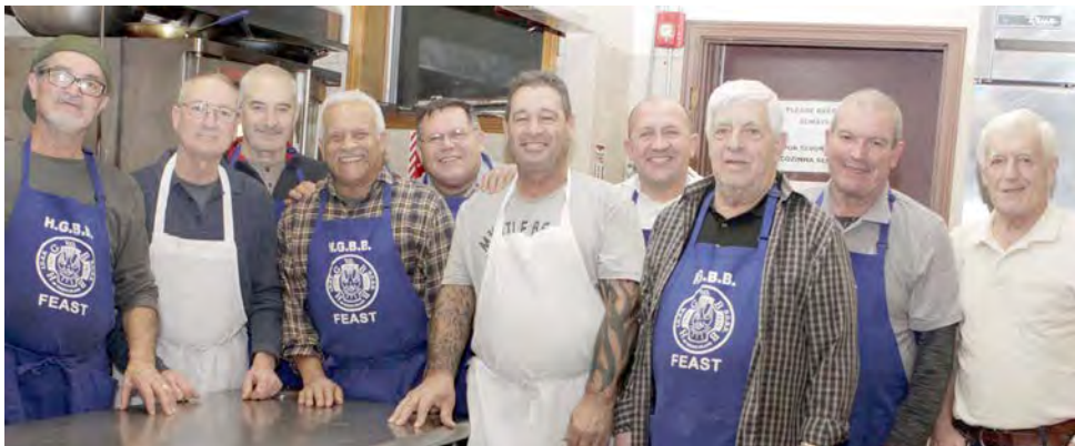
Na foto acima, o grupo que esteve de serviço na cozinha durante a matança de porco e na foto abaixo, senhoras do Grupo da Amizade.