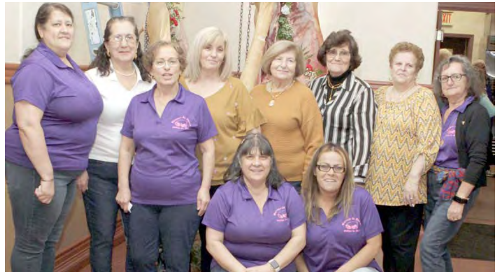
O Grupo da Amizade do Phillip Street Hall em East Providence.

Santos (Feira das Febras), que atraia gente de todo o Portugal, mesmo de Lisboa.