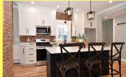
RUMFORD Colonial $549.900