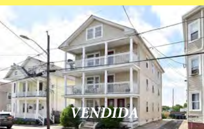
PROVIDENCE 3 moradias $499.900