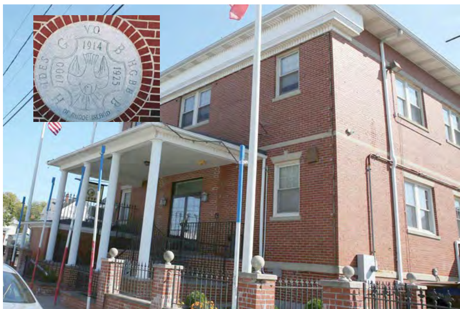
Saudamos todos aqueles que contribuíram para o êxito da matança de porco!