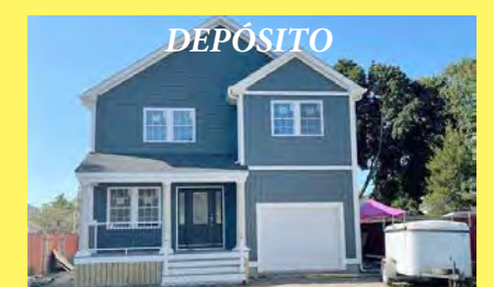
PAWTUCKET Colonial $459.900