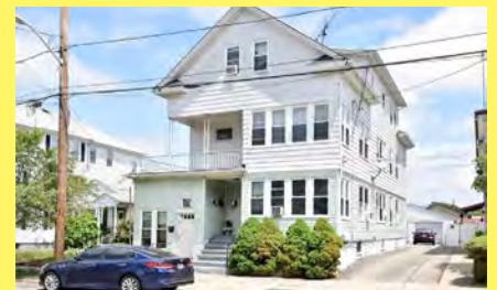
PROVIDENCE 4 moradias $589.900