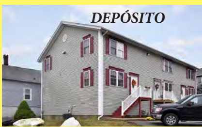
CENTRAL FALLS Condomínio $229.900