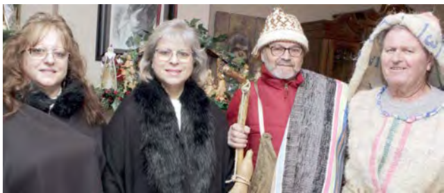
As fotos acima e abaixo documentam momentos de Cantar as Janeiras na igreja de Nossa Senhora de Fátima em Cumberland.