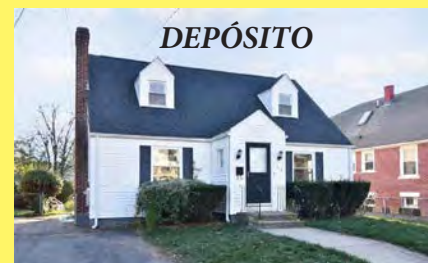
EAST PROVIDENCE Cape $339.900